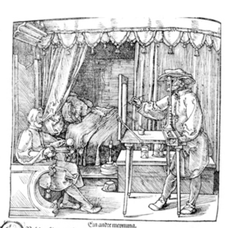
Descriptive Geometry Pdf

Ein andre meyening. Bich dien feden magift du ein verlich ding das du mit errenchen kanft in eingemelbingen auf ein da fel sincersendenn dem thu alfe.